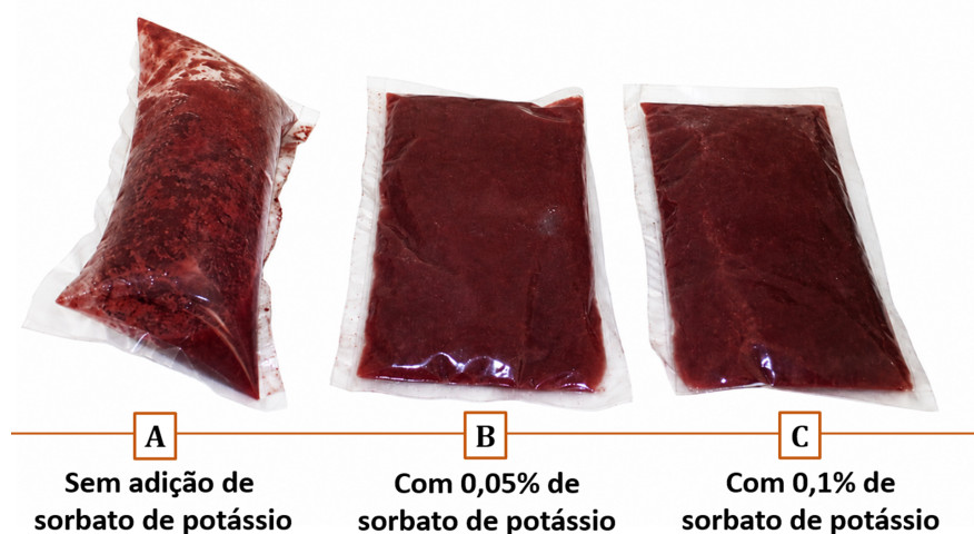
Figura 1 - Ocorrência de estufamento na embalagem (A) contendo preparados de frutas vermelhas sem sorbato de potássio após 30 dias armazenados a 25 °C.

estratégico para a indústria, eliminando a necessidade da cadeia de refrigeração e reduzindo os custos de armazenamento, transporte e distribuição. Além de aumentar a eficiência logística, o processamento de frutas perecíveis reduz perdas pós-colheita, agrega valor à matéria-prima e amplia as oportunidades de comercialização. O uso de 0,05% apresenta vantagens econômicas, decorrentes da redução do consumo de conservante.